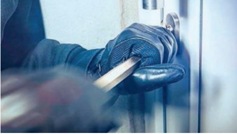
Eingebrochen wird in der Schweiz zumeist kurz nach Mittag oder zur Dämmerungszeit und weniger mitten in der Nacht.